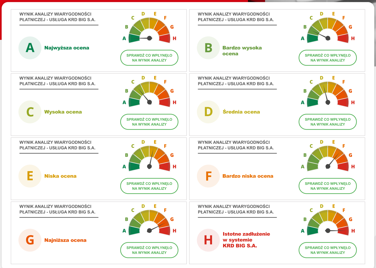
Rysunek 1. Grafiki przedstawiające poszczególne kategorie wiarygodności płatniczej

Usługa polega na ocenie podmiotu pod kątem jego wiarygodności płatniczej, czyli zdolności do terminowego wywiązywania się ze zobowiązań pieniężnych, a następnie przypisaniu mu – jako wyniku analizy - jednej z następujących kategorii wiarygodności płatniczej (patrz rysunek 1).